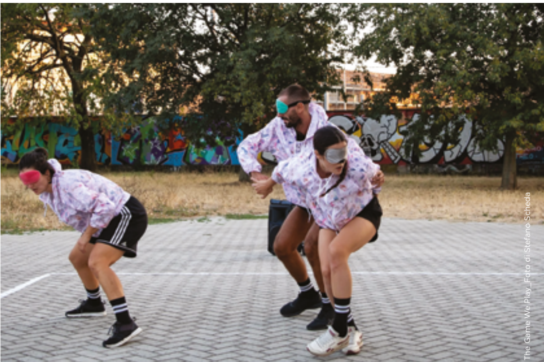
The Game We Play

posti disponibili. Per info e iscrizioni inviare una mail a f.zaganelli@hotmail.it entro il 3 settembre indicando nome, cognome, data e luogo di nascita, codice fiscale e numero di telefono.